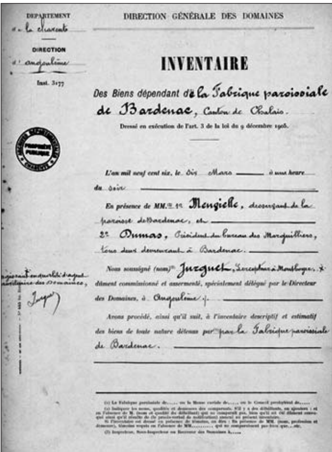
Document d'inventaire de la paroisse de Bardenac.

grer la CGT et FO. Après l'instauration du régime gaulliste, en 1958, la loi Debré du 31 décembre 1959 institua officiellement le dualisme scolaire au nom de la « liberté de l'enseignement » : l'État prend en charge les salaires des enseignants des écoles privées sous contrat, au nom de la participation des écoles confessionnelles au service public d'enseignement, tout en reconnaissant leur « caractère propre » en matière d'éducation. La CGT participa largement à la lutte contre la loi Debré en soutenant la pétition nationale du Cnal. Plus de 10 800 000 signatures furent recueillies par les militants laïques. En vain ! Dès 1961, la CGT reprit la lutte pour la défense de l'enseignement public et de l'université, ainsi que pour arracher l'apprentissage des mains du patronat.