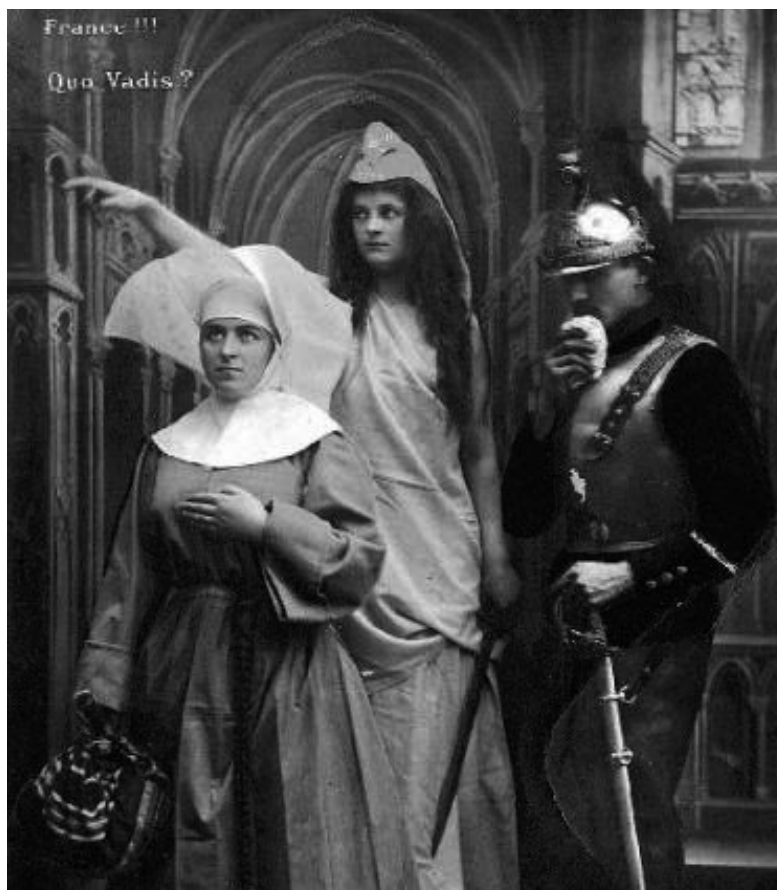
La République donne congé à l'Église (carte postale).

La France a été à l'avant-garde dans l'affirmation des principes de la laïcité (5) . Jusqu'en 1789, c'était un royaume de droit divin, donc un État confessionnel avec le catholicisme pour unique religion officielle. Pourtant, la monarchie française a été la première en Europe à contester la suprématie de l'autorité spirituelle et temporelle des papes sur tous les États. L'autonomie de la politique par rapport à la religion n'est cependant pas encore la laïcité. Au principe « tel prince, telle religion » prévalant en Europe après la Réforme, la France, la première, a substitué la notion de tolérance avec l'Édit de Nantes, concédé par Henri IV aux protestants, en 1598, pour mettre fin aux guerres de religion. Mais la tolérance n'est pas la reconnaissance d'un droit inaliénable égal